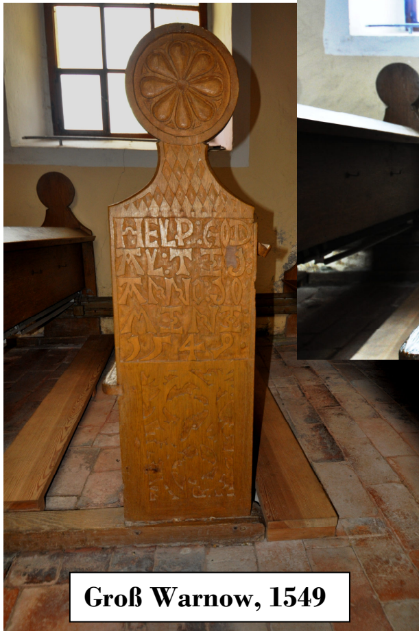
Groß Warnow, 1549